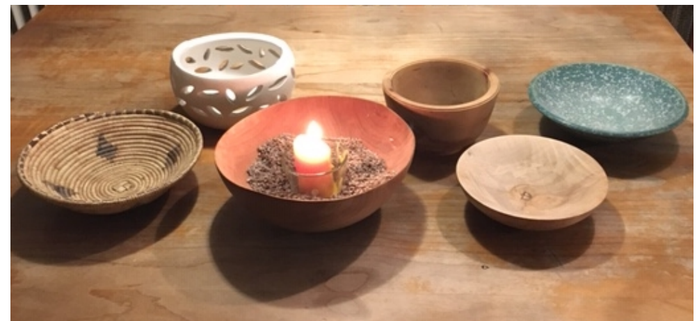
Vorschlag für Schalen für die Adventsreihe (siehe Seite 4)

Nimm eine Kerze in die Hand und geh und glaube: Das Wunder bleibt nicht aus!