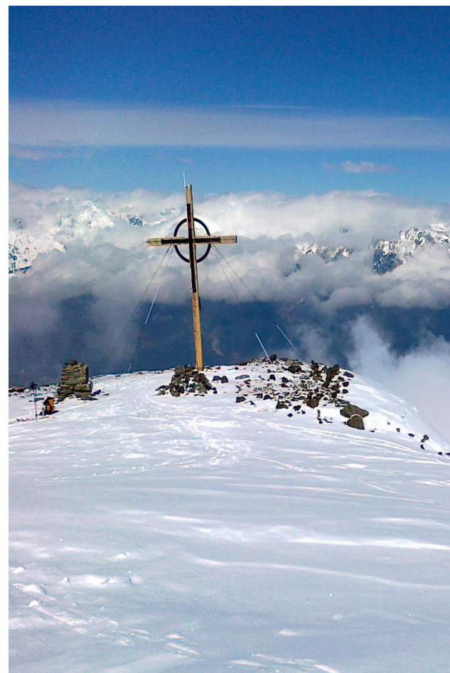
Gipfelkreuz am Glungezer