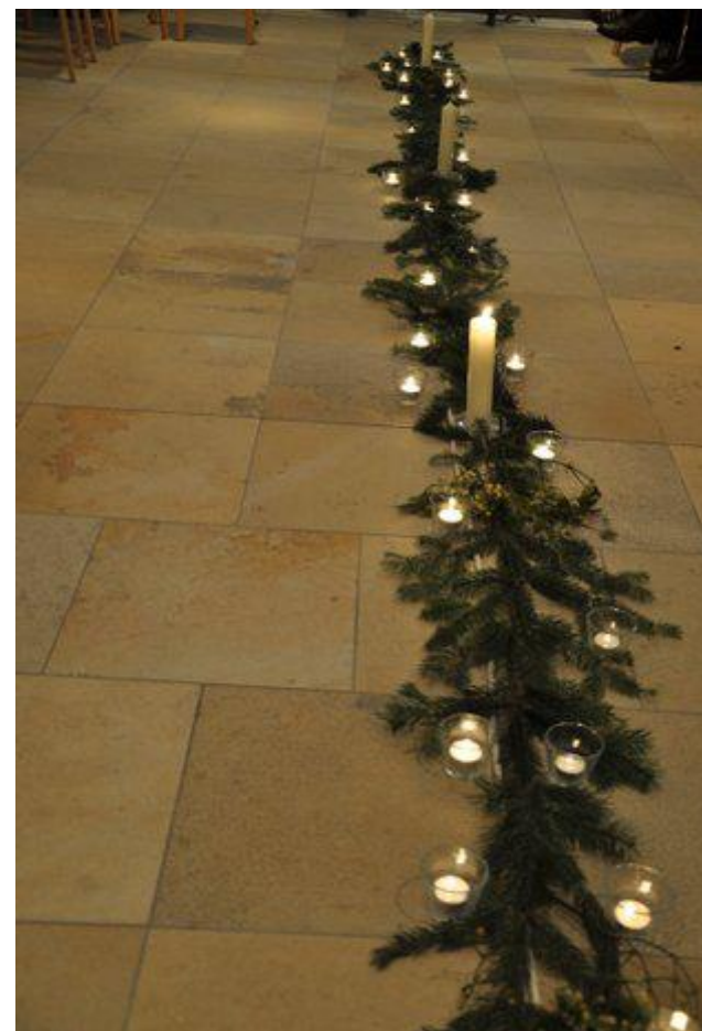
Leuchtsuren der Menschenwürde Adventskranz 2015 der Unterkirchengemeinschaft